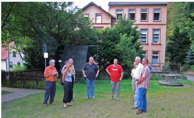
Die Fraktion in Schönberg